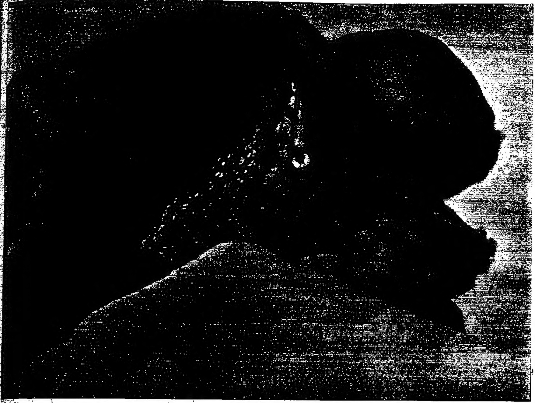
السفارة التي تمنع القنصلية الحولية المصابة... سفاهة تهمس باللعنة على الراية الممتدة ومن يقفون وراءهم... يدعونهم بوسائل العدوان والحرب... هذه الامم من غور الصافي، اصاب المعتدون الاسرائيليون فلذة كبدها، وهي امة مطمئنة في هدأة الليل، فهرعت اليها تحنو عليها، وتلمن المعتدين ان الله يهل ولا يهل.